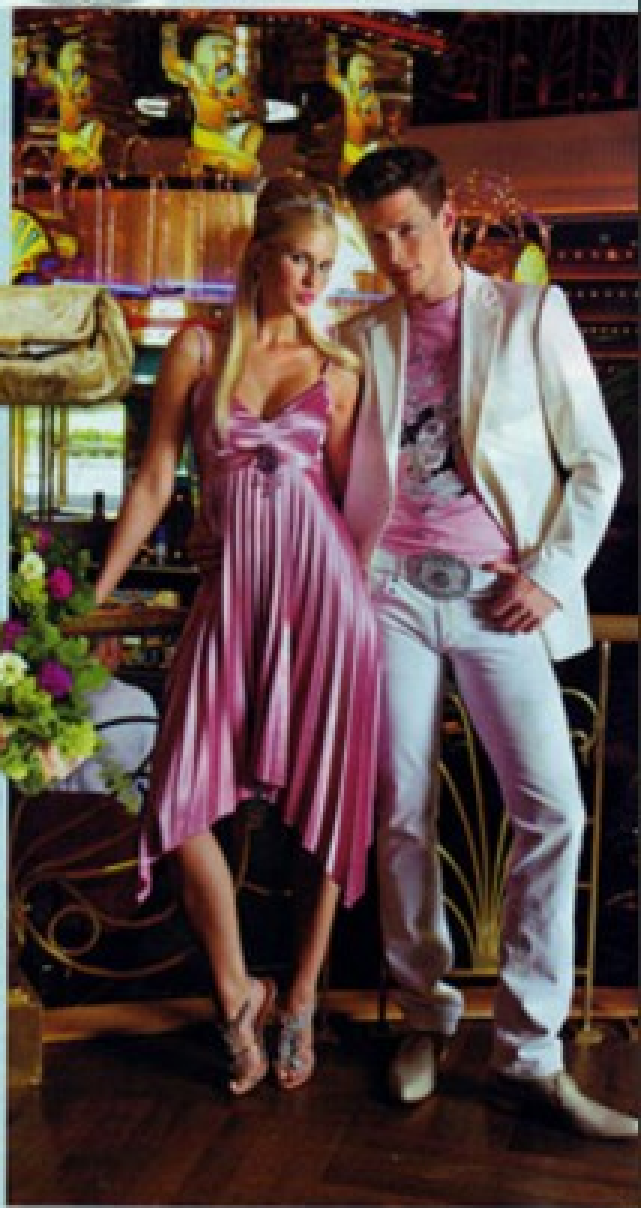
Wald mit Braut von Corderia, Wien 1, 140 Euro, Schuhe mit Swarovski-Steinen von Giuseppe Zanotti bei Corderia, Wien 179 Euro, Schuhe von Gae Peters, Wien 1, 260 Euro, Schmuck von Swarovski von Philipp Pecher bei Gae Peters, Wien 1, 440 Euro, Ring von Cartier bei Gae Peters, Wien 1, 270 Euro, Schmuck von Cartier bei Gae Peters, 270 Euro, Schmuck von Swarovski bei Swarovski, Wien 1, 84,90 Euro