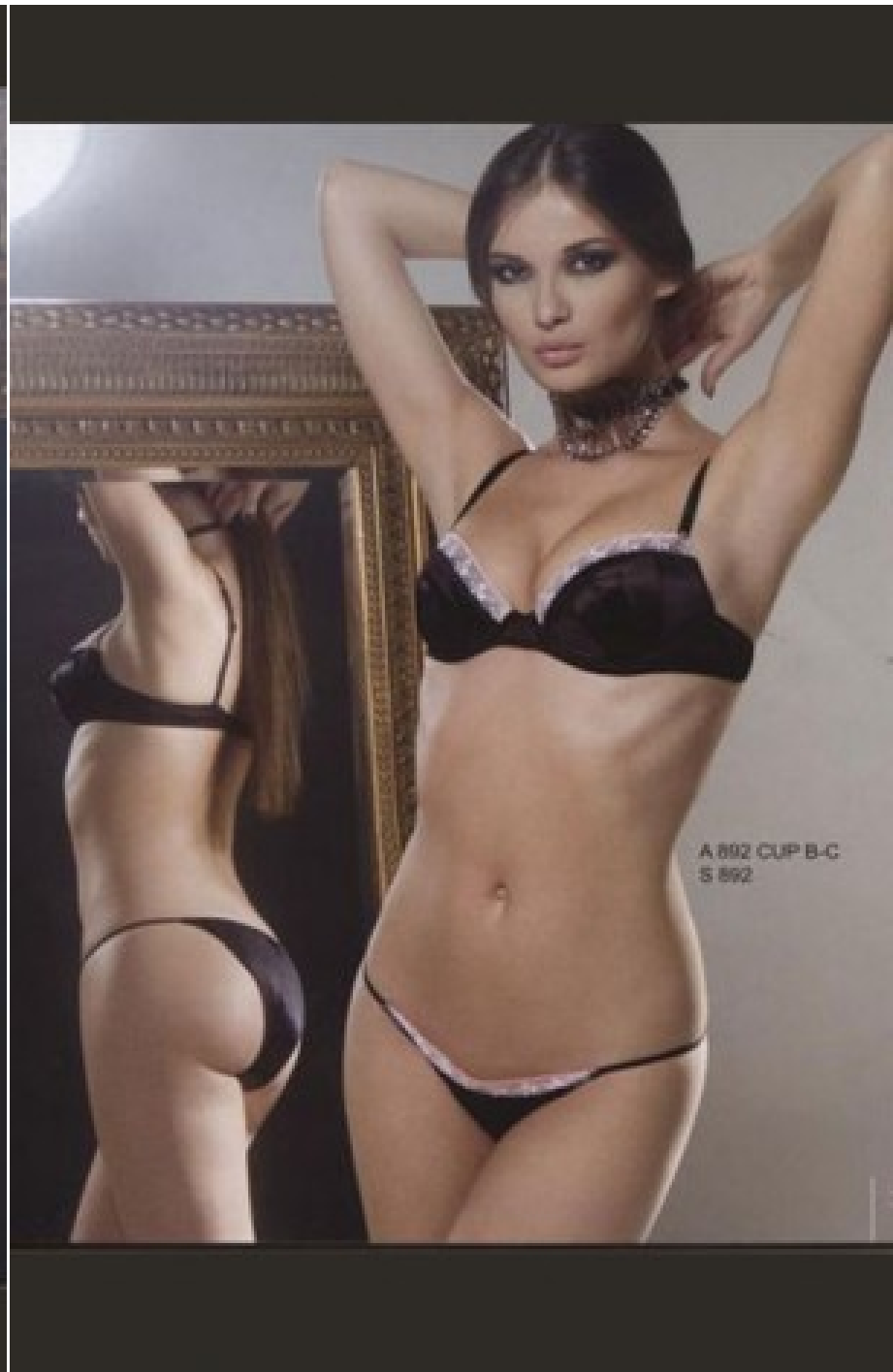
A 892 CUP B-C S 892